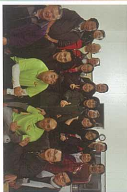
短宣隊與「墨爾本飲食業福音團契」合照。