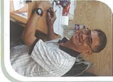
以信心去講道，並交託給那位 信實無變 的主！