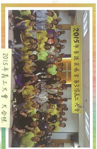
2015年義工大會 大會合照

5. 求神記念2016年11月11日的F.O.O.D. 義工大會，讓各義工一同分享今年的得著。我們歡迎不同的弟兄姊妹加入我們 F.O.O.D. (Friends of Operation Dawn) 晨曦會之友)的義工行列，請踴躍參予，讓你的愛能流入這個需要你的群體，我們愛，因為神先愛。