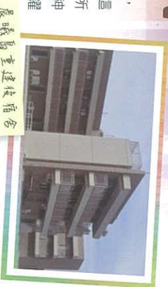
晨曦島重建後宿舍

1. 請記念重建後的各項牌照能順利成功申請，特別記念消防處、社署、環保署和地政署這4個政府部門的牌照申請能順利通過，所有同工學員並能盡快正式入住新宿舍。求神為我們預備最合適的日子作開幕禮，願榮耀歸予 神！