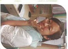
都從沒有忘記我們。見證神豐盛的恩典和大能，感謝主！