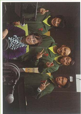
短宣隊接受電台訪問，見證神的大能。

感謝神！我由從前一個吸毒者，變 為現在被神使用的僕人。在過去四 年多，神與我同在，並給予我豐盛 的生命。更感恩的是我被差派去了 兩次澳洲短宣。2014年短宣，我學 習要對神有等候和信心。2016年短 宣，我更體會到只要是神的揀選， 不管自覺多麼不配，也會得神的使 用。這兩年的操練，讓我學懂要常 作準備，要有隨時被神使用的心。 作為神的僕人，對神的操練順服， 對神的差遣要忍耐及有信心，為下 一次被神差遣作準備！哈利路亞！ 榮耀頌讚歸給主耶穌基督！