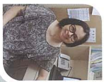
柱和夜間的火柱，總不離開我們。

這個同工又大又難，前線後方都是屬靈爭戰的地方。這次跟大家介紹辦事處同工，與他們一同經歷如何在晨曦中看到神的豐盛！