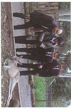
來澳洲，當然要與我最近距離接觸！

這次短宣讓我深深經歷神的豐盛恩典和慈 愛。到達澳洲那天起，我們便得著弟兄姊 妹的熱情款待；從住宿、膳食及車程接送 都是盡心安排。在他們身上體會到“接待遠 人”的真理教導，在墨爾本認識一位接待我 們的弟兄，雖然他今年已經69歲，但仍到 神學院接受神學課程的裝備，為的是豐富 真理知識，來傳福音領人歸主。他們的愛 心服事和熱心侍主，使我被激勵。我以他 們的生命事奉成為學習的榜樣。感謝神！ 祂讓我堅定心志，委身事主。