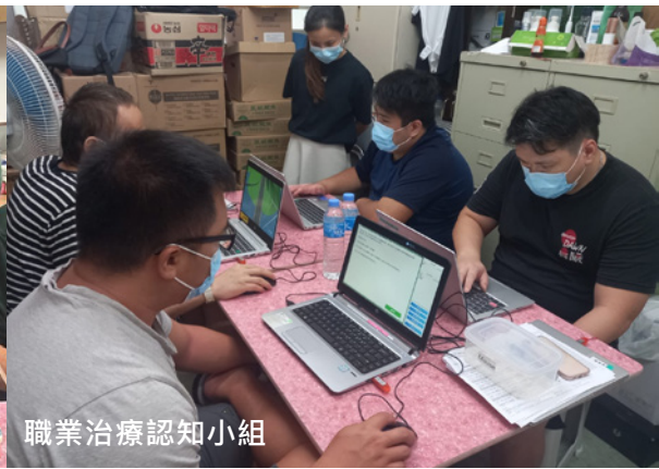
職業治療認知小組

學員因服用危害精神物質，使不少學員精神健康上受損，其中會出現認知能力受到缺損、較易出現負面情緒，所以中途宿舍今年與路德會青欣中心合辦 4 節 手工小組 ，結合製作暖包、礦香石、護手霜和杯墊的手工和靜觀技巧，加強學員應對壓力的方法及正面情緒的，4 節小組中學員一起進行靜觀身體掃描，以加強他們的正念。