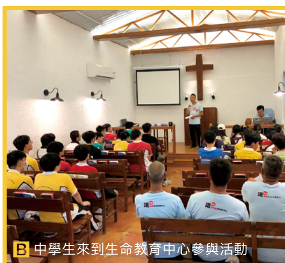
B 中學生來到生命教育中心參與活動