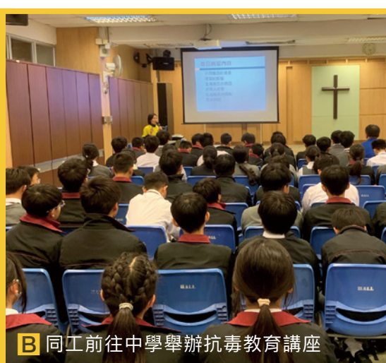
B 同工前往中學舉辦抗毒教育講座