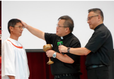
▲過來人同工和弟兄接受灑水禮，在神在人面前表明決心跟從基督