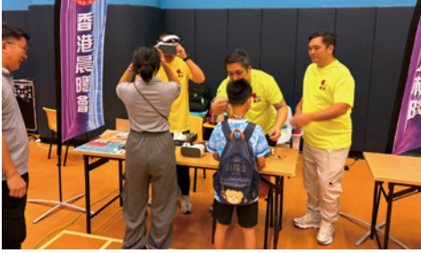
▲本會獲邀於荃灣警署減罪活動中舉辦攤位，向該區中小學生分享抗毒信息