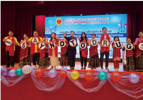
▲香港尼泊爾聯會舉辦抗毒及家長教育研討會，南亞裔同工獲邀於會上介紹晨曦會事工和分享生命見證

的經驗裡，與求助者建立關係至為重要，所以同工都會很有耐性的與他們傾談，尤其是外展同工都是過來人，很清楚吸毒者的思維和行為模式，也十分明白求助者所面對的困難和軟弱，所以在探訪過程中當他們感受到我們的理解和關懷，對我們有了信任，對日後決定是否來戒毒，就多了一份助力。請大家為我們的外展同工禱告，求神使用和加力。 今期的「晨曦見證」有一位過來人同工講述自己的生命如何被神更新改變，使我們同得激勵！在福音戒毒事工中，我們深明屬靈爭戰何等激烈，無論是戒毒或事奉之路，人要行得穩健，都必須以神的話作腳前的燈，才能勝過試探，過上得勝的生活，事奉有力。我們特別重視學員的讀經情況，由牧者編排每日靈修經文以助學員理解聖經內容；逢週六各家舍舉行細胞小組，與學員分組閱讀聖經，彼此分享體會，同工也能關顧學員的生命狀況。我們盡力栽種澆灌，但叫人成長的始終是神，願神的話光照我們學員和同工的生命。