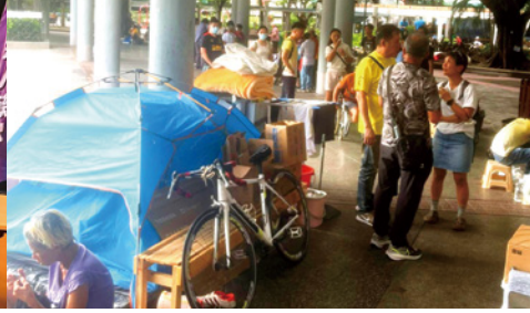
▲外展同工與牧者一起前往露宿者聚居的地區探訪和派發單張

踏入秋季，又是晨曦島舉辦開放日的時節了，今年兩次，分別於10月25日和11月22日舉行，我們正密鑼緊鼓地籌備當中。我們亦歡迎學校、機構或教會團體組團來訪，我們珍惜每個能見證神拯救大能的機會，願主使用我們。晨曦會歡迎您！