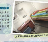
晨安館內設置早期介入學員的任務環境