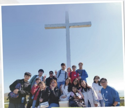
在晨曦島的島嶼，十字架山分節

得多方面的學習。活動包括：「VR體驗」進入虛擬戒毒空間；「故事體驗」揭示毒癮者心靈的幽暗角落，讓人領略成癮行為的可怕；過來人的生命見證提醒我們戒癮生活的悲劇，並分享因信仰成功脫癮、重獲新生的鼓舞經歷；戒毒遊戲讓我們親身感受毒品對身體的破壞；環島導覽帶領我們探索晨曦島及周邊的地質生態，從大自然中發現上帝的奇妙創造。